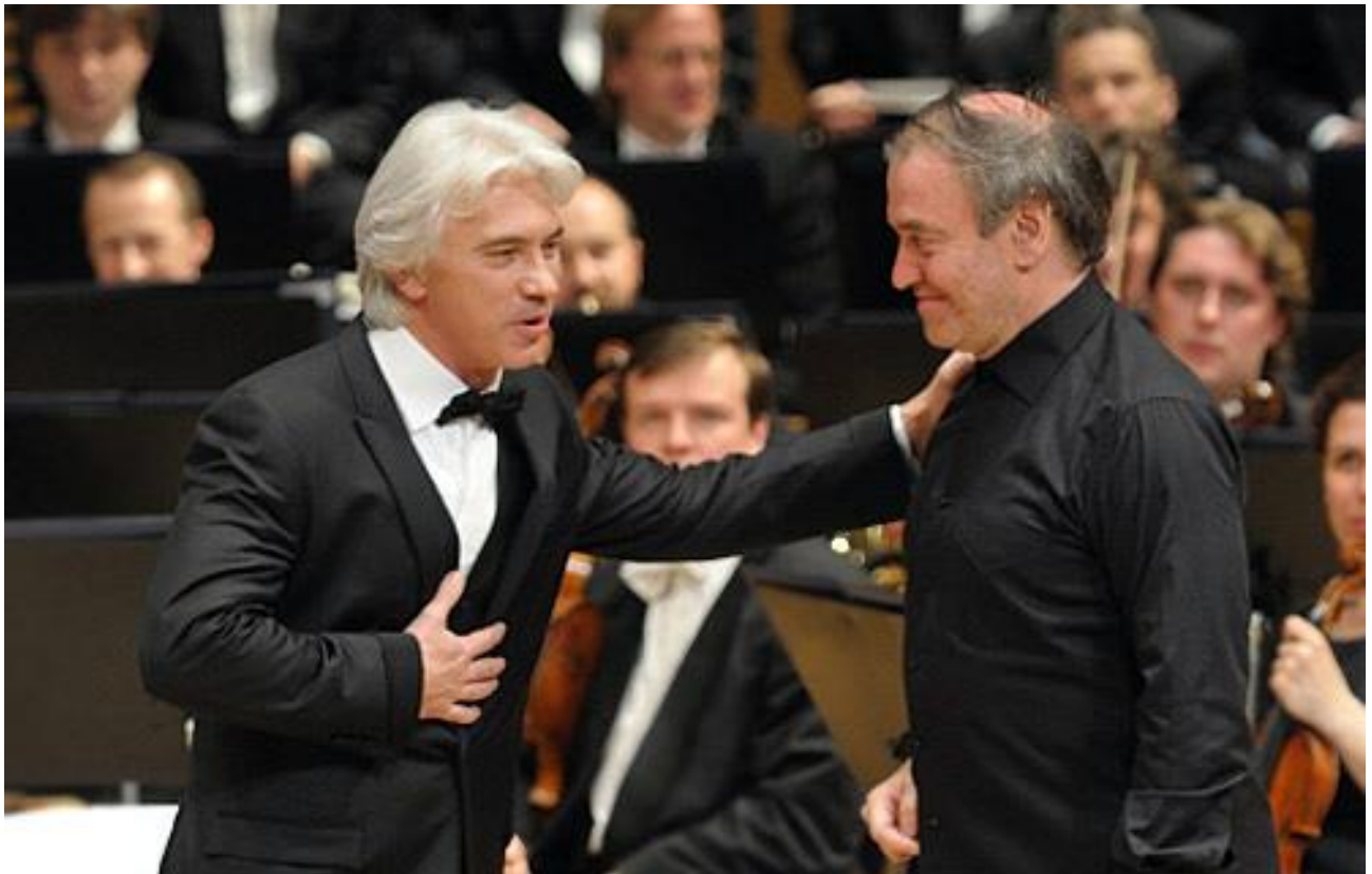
Дмитрий Хворостовский и Валерий Гергиев