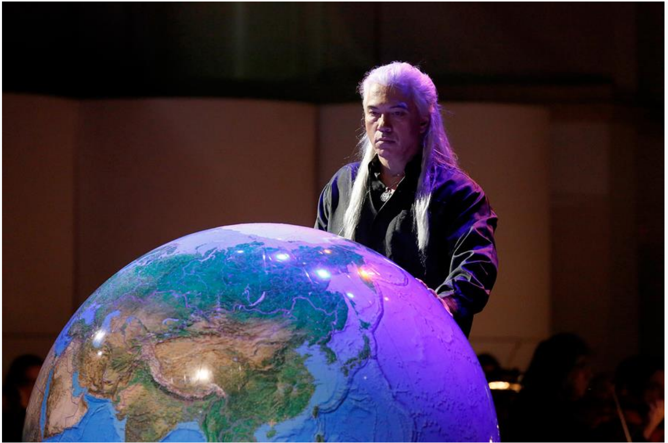
Дмитрий Хворостовский в образе Демона