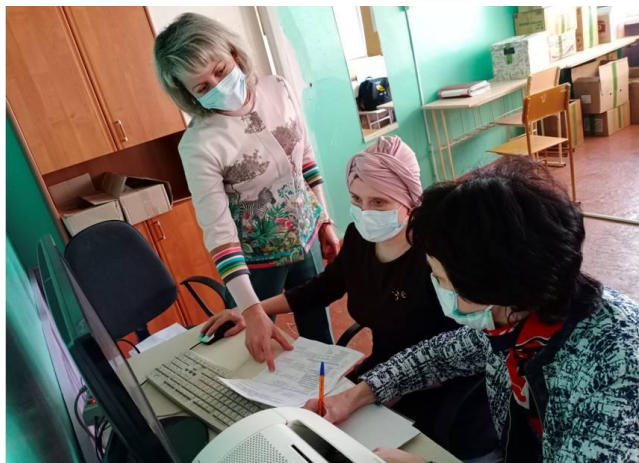
Жюри оценивает работы в номинации «Музыкальная литература»